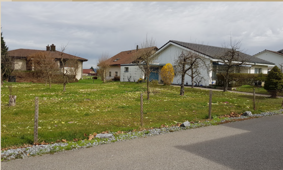
30er Zone - Familienfreundlich

Gebaut wird mit dem nachwachsenden und ökologischen Werkstoff Holz. Kurze Zeit nach Baubewilligung ist Ihr Haus schlüsselfertig erstellt und bezugsbereit.