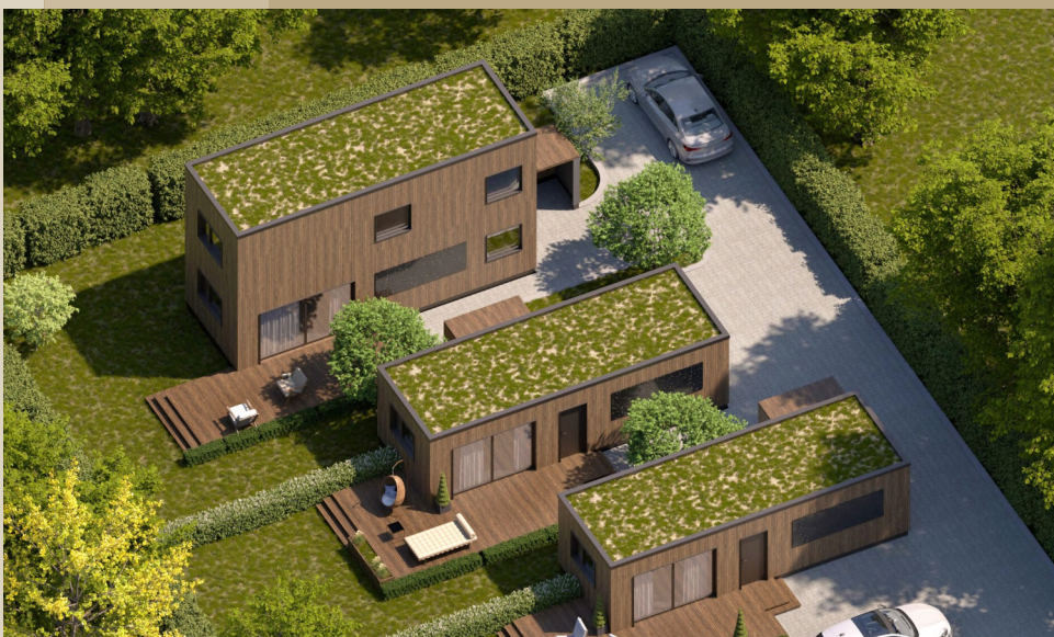
Ein- oder Zweigeschossig