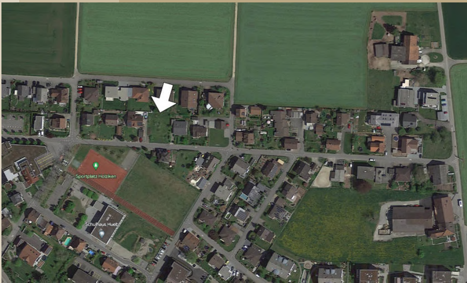
Mitten in Holzikon