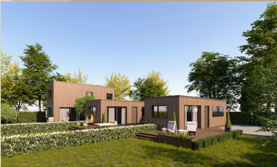
Geeignet für Senioren und Singles