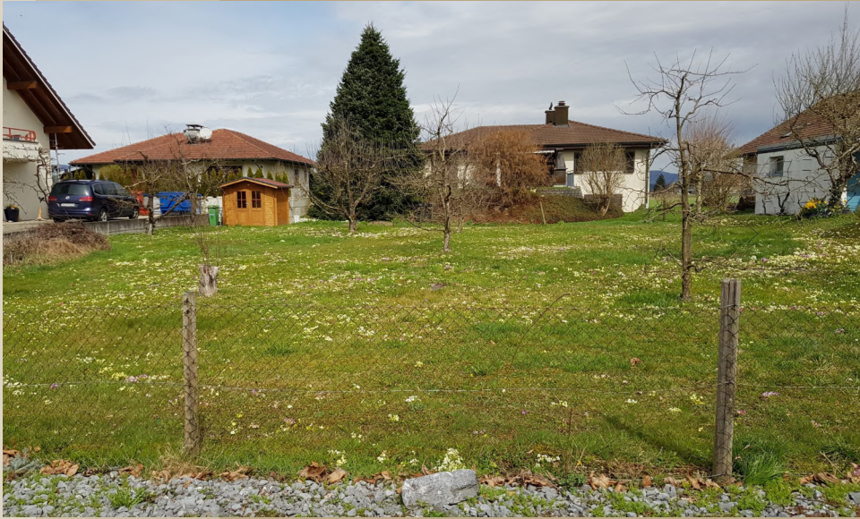
Huebstrasse, Holziken AG