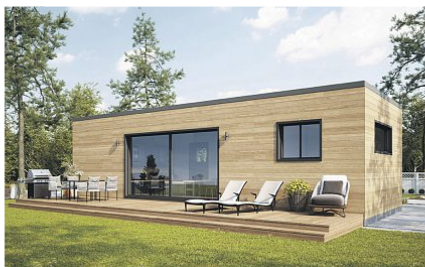
Singlehäuser sind auch in der Schweiz gross im Kommen.

Houses. Das Angebotsspektrum ist äusserst vielschichtig. In der grossen Ausstellung am Hauptsitz in Arbon findet der Kunde nahezu alles, was sich aus Holz bauen lässt. Vom Gartenhaus über Pavillons, Lauben, Carports, Sichtschutzwände oder Ställe für die Kleintierhaltung bis hin zu CampingPods sowie interessante Beispiele realisierter Projekte.